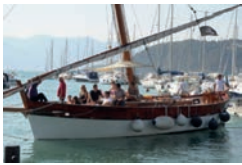
Goletta Pandora Leudo Zigoela Vele Latine